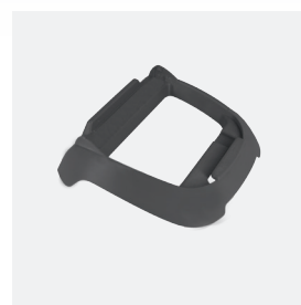
Socle pour boîtier de commande