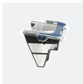
Bac filtrant (3 L) débris fins 100 microns